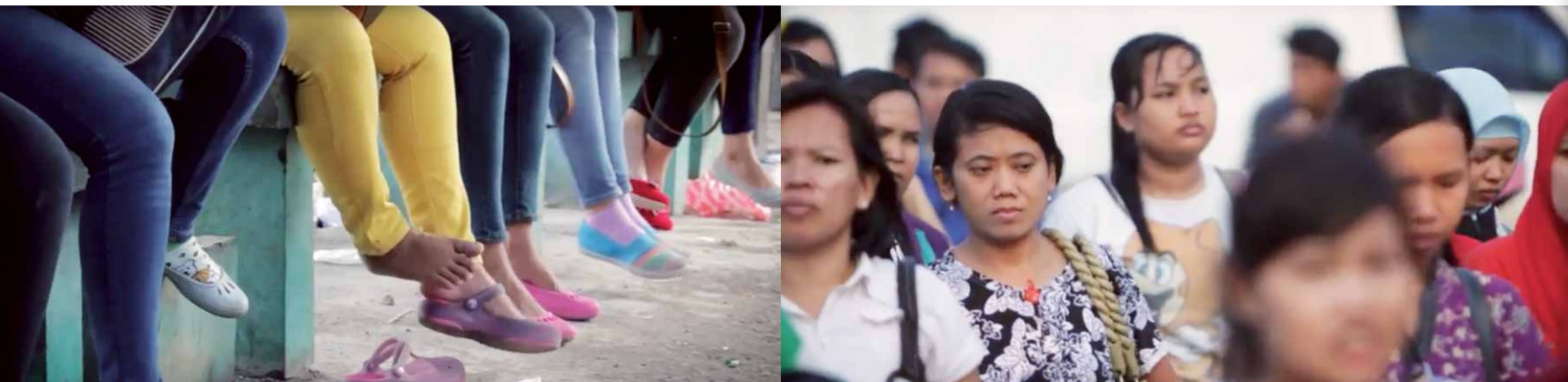
Reeks stills uit de film ‘The day the voices raised’.

vrouwen onderling. Maar liefst 93,6 procent van de slachtoffers doet dan ook geen aangifte. Tijd voor actie, dachten de vrouwen van FBLP en PM. Ze wilden een documentaire maken met verhalen van slachtoffers, de schaamte en de gevolgen. Maar eigenlijk durfde niemand voor de camera dit verhaal te doen. Ondertussen maakten de organisaties zich hard voor een billboard in de EPZ met de tekst ‘Seksuele intimidatievrije zone’. En daaronder de aanmoediging: ‘Laten we samen de werkplekken vrij maken van alle seksuele intimidatie’. Over die onverwacht moei-zame weg gaat nu de documentaire. De cameravrouw die ook de interviews deed, is zelf eveneens textielarbeidster. Ze filmde en monteerde de hele productie. De professionele kleurcorrectie maakt de documentaire tot een volwassen film die gebruikt wordt tijdens bijeenkomsten.